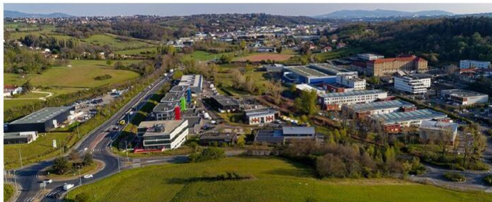
Le projet vise à aménager sur la zone AU12 des lots à construire à destination de PME de l'Ouest lyonnais.

Une procédure de concertation préalable, relative à l'aménagement par la CCVG, d'une zone d'activités économiques sur le secteur de Moninsable, est ouverte jusqu'au 13 octobre inclus. Une réunion publique aura lieu lundi 2 octobre à 18 h.